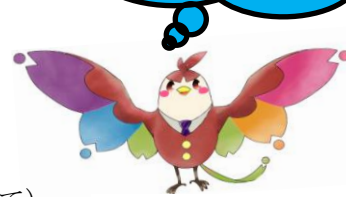
東桜学館マスコットキャラクター 桜輝（さくらっきー）